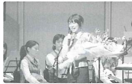
地元出身・横江さんの心温まるスピーチ