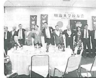
ズはやっぱり、白雲なびく～♪駿河台～♪