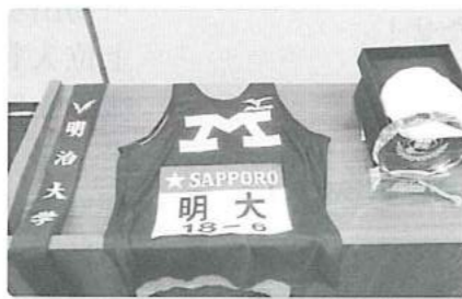
箱根を駆け抜けたゼッケンと襷...レア物です