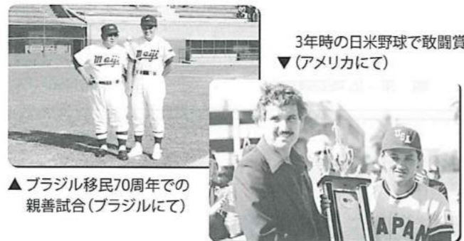
▲ブラジル移民70周年での親善試合(ブラジルにて)