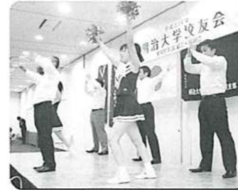
懇親会に欠かせない応援団の元気一杯なアトラクション