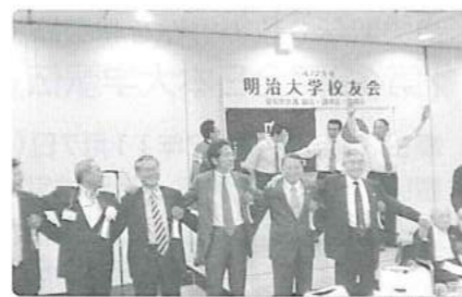
♫はやっぱり全員で校歌斉唱