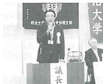
リーダーシップの発揮が期待される西脇新支部長の挨拶