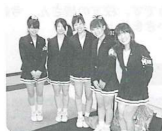
明日の母校を支えるのは君たちだ！笑顔がいいね！