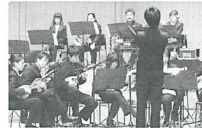
若さ溢れる演奏にエネルギーをいただきました

■日 時/平成22年8月26日(木) 18時開会 ■会 場/愛知県芸術劇場コンサートホール