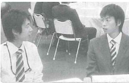
箱根優勝への襷を後輩に託す中村・安田両氏