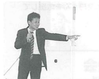
伝統の島岡イズムを楽しく語っていただいた豊田講師