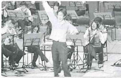
夢は俳優、指揮者・前畑君のジャンプ!