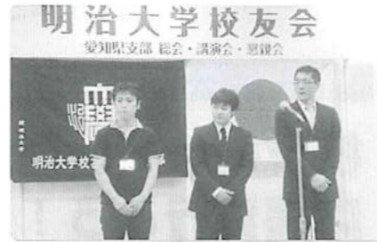
新入会員も壇上で自己紹介