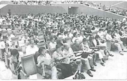
今年もたくさんの方々にお集まりいただきました