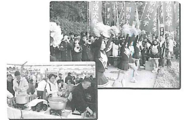
平成22年11月7日(日) スタート午前8:10 名古屋市熱田神宮~伊勢市伊勢神宮 106.8km

また、今回は、初めての試みで選手スタート後に、懇親朝食会を設営。参加された校友からは、楽しみが一つ増えたと、早速好評を得ておりました。