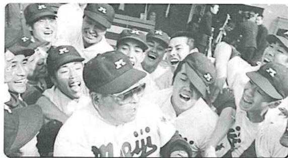
4年の春にリーグ戦で見事優勝

豊田氏：それがマズかったんですね。首位打者を獲るなら4年の秋に獲るべきです。そうでないと、以降、「お前天狗になりやがって！」と鉄拳が飛んでくる