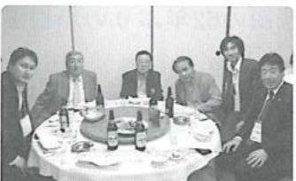
テーブルでの記念撮影