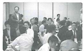
とにかく盛り上がりがありました!

校友会始まって以来、初の試みとしまして、「明治はひとつ交流会」を企画開催し、70名に迫る校友で、会場の百楽さんは、興奮の坩堝と化しました。