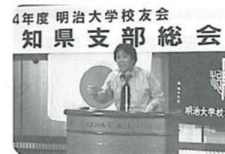
流石エンターテイナー、会場は爆笑の渦に包まれました