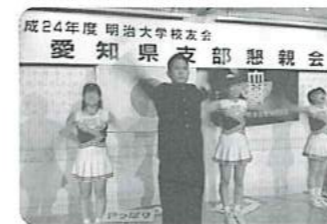
流石現役、スピードが違う!