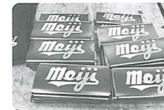
チョコレートもMeiji♪レアアイテムの記念品です