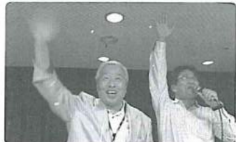
見事じゃんけんゲームを制しました。今日の主役はオレだぜ~!

今回の趣旨はいたって単純、「もっと仲良く、もっと愉しく」ということ。肩肘張らずに明治らしく、ざっくばらんに「飲もう!」という大交流会でしたが、87歳の大先輩から2011年卒のニューフェイスまで、老若男女が世代の垣根を越えて、懇親を深めることができました。次回は2月に開催予定。詳細決定次第ホームページでもご案内いたしますので、皆さんお誘い合わせの上、是非ご参加くださいませ。