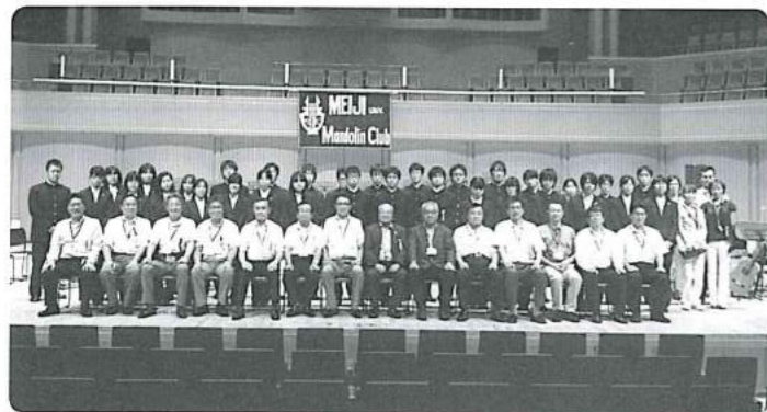
開場前に記念撮影、現役部員が撮影してくれました!ありがとうございます!

日時：平成24年8月18日(土) 17時開演 会場：愛知県芸術劇場コンサートホール