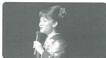
流石大御所、大人の歌を聴かせてくれましたね