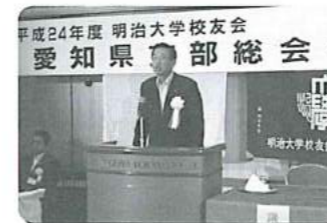
西脇支部長の挨拶も貴賓が出てまいりました