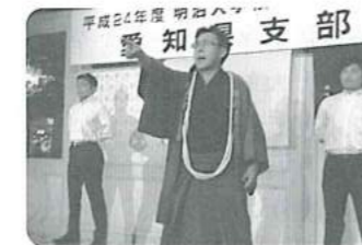
OBも負けてませんよ~!