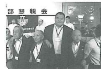
親方も一緒に、おお~、メイジ~!