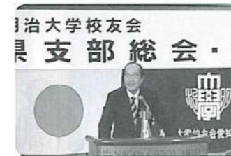
向殿校友会本部会長のご挨拶