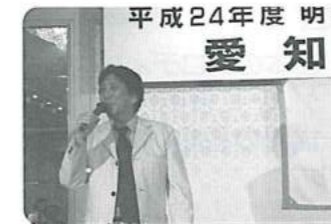
懇親会でも弾ける松尾ワールド!