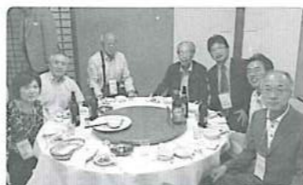
テーブルでの記念撮影