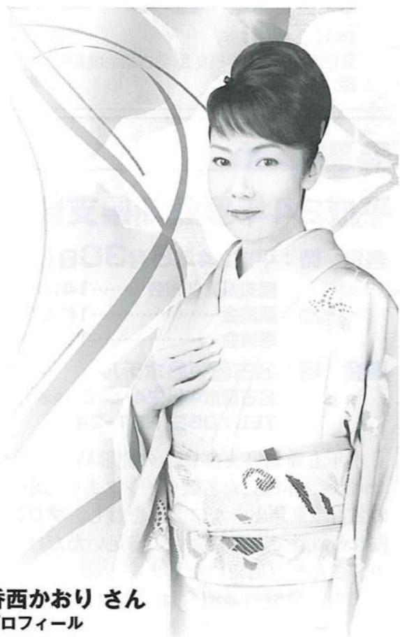
香西かおりさん プロフィール

大阪府大阪市生まれ 幼い頃から民謡で各種の賞を受賞し、本名の「香西香」名義で民謡のレコードも発売。 1982年、太陽神戸銀行(現・三井住友銀行)に入行も、歌への想いが募り退行。歌手になるため上京し、1988年に演歌歌手として「雨酒場」でデビュー。 1993年、「無言坂」が初めてオリコンチャートで10位を記録、同曲で第35回日本レコード大賞を受賞。紅白歌合戦出場15回、本年芸歴25周年を迎え、本年2月8日には25周年記念シングル「糸車からり」を発表。 ジャンルは演歌のみならず、ポップスから民謡、歌謡曲まで幅広くこなす。 好きなものは、美味しいお酒とお料理。お酒は飲んででも飲めない、美味しいお酒はいくらでも飲める、がポリシー。