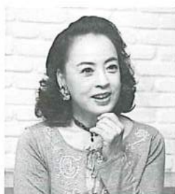
H21 阿木曜子氏(作詞家)