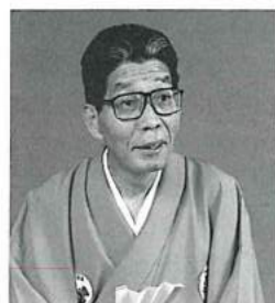
H20 三遊亭円丈氏(落語家)