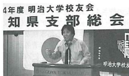
H24 松尾雄治氏 (元ラグビー日本代表、スポーツコメンテーター)