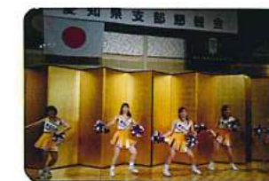
チアリーダーOGによるリーディング。