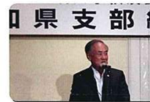
間瀬副支部長よりご挨拶。