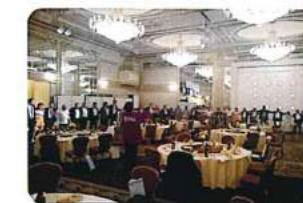
最後に会場が一つの輪で繋がる。