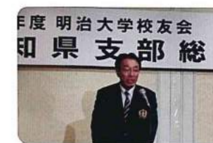
支部総会での西脇支部長挨拶。