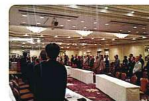
総会開会の辞の後にまずは校歌斉唱

会場を移して開催されました懇親会では、大西氏にも参加いただき、約200人の校友が集いました。それぞれのテーブルで歓談の時間を過ごしたのち、今年度は現役チアリーダーの都合がつかなかったためチアリーダーOGが登場。現役にはない色気満載のチアリーダーOGによるパフォーマンスで大いに盛り上がりました。応援団OBによるアトラクションから、最後には恒例の全員が輪になっての校歌熱唱により、「明治はひとつ」を堪能して閉会いたしました。