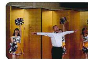
OB、OGとは思えない迫力。